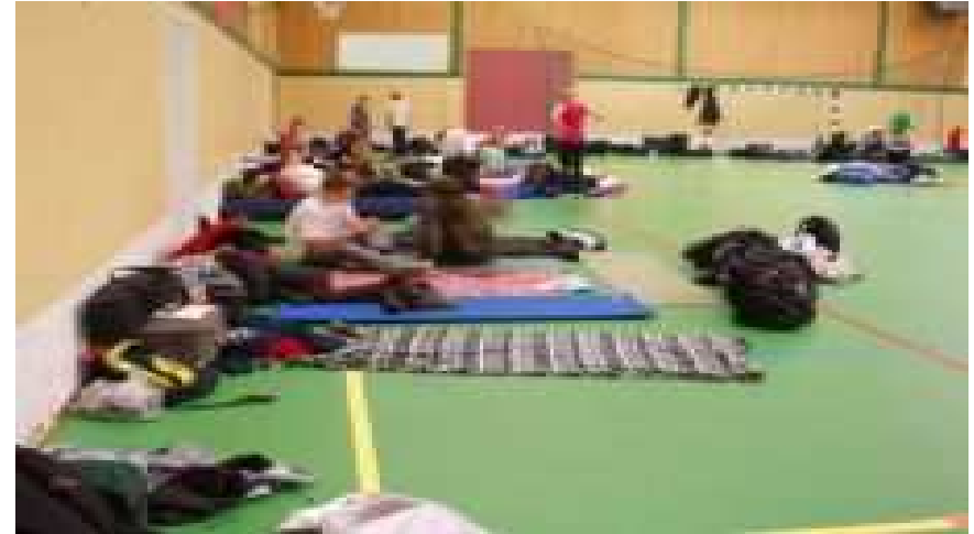
Eksempel indretningsplan midlertidig overnatning.